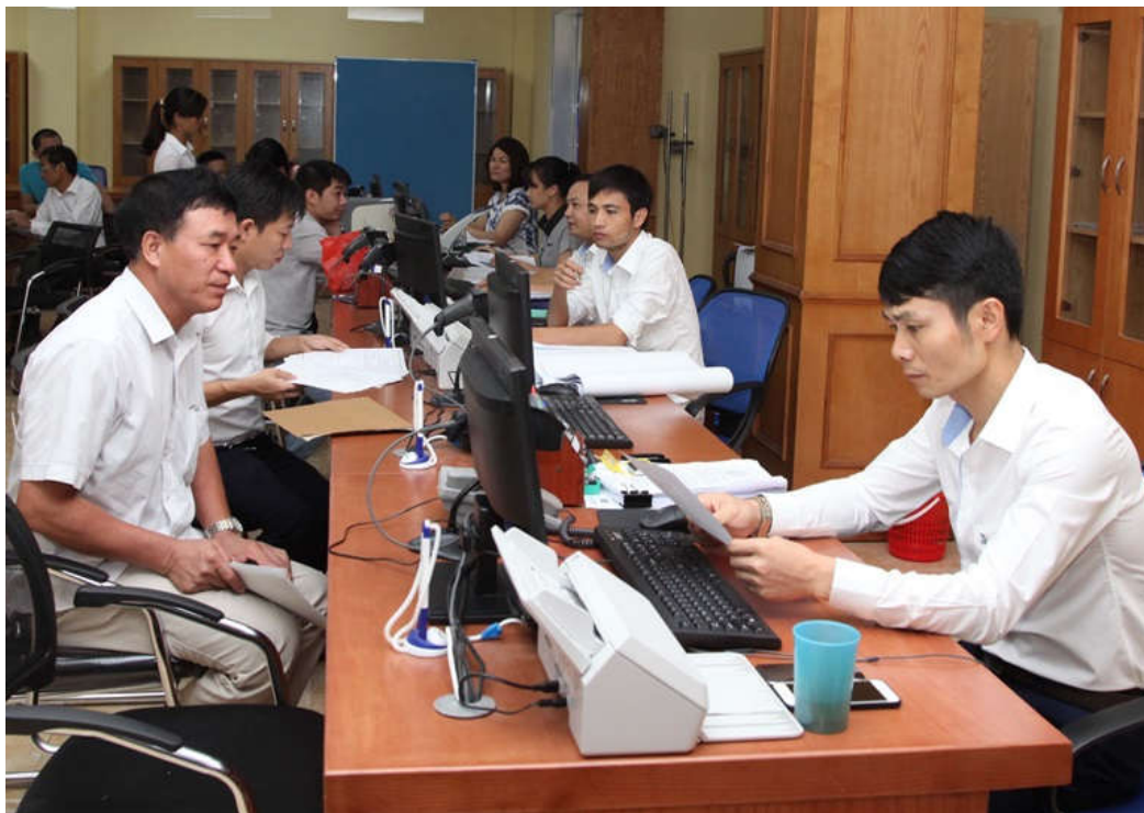
Công dân thực hiện thủ tục hành chính tại Trung tâm Hành chính công tỉnh.

Giải quyết thủ tục hành chính theo phương thức “4 tại chỗ” (tiếp nhận hồ sơ, thẩm định, xét duyệt và trả kết quả tại chỗ) nhằm nâng cao hiệu quả cải cách thủ tục hành chính (TTHC) là mục tiêu trong cải cách hành chính mà nhiều địa phương đang hướng tới, trong đó có Vĩnh Phúc. Tuy nhiên, việc triển khai chủ trương này vẫn còn gặp nhiều khó khăn.