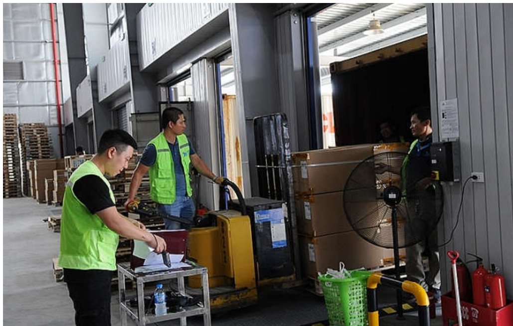
Tạo thuận lợi cho DN xuất khẩu sang các khu vực đã có FTA

Thông tin được đưa ra tại cuộc họp đánh giá kết quả công tác 6 tháng đầu năm và phương hướng nhiệm vụ 6 tháng cuối năm 2019 của Ủy ban quốc gia về cơ chế một cửa ASEAN, một cửa quốc gia và tạo thuận lợi thương mại và logistics (Ủy ban 1899) tổ chức mới đây cho thấy, tính đến ngày 10/7/2019, đã có 174 thủ tục hành chính của 13 bộ, ngành kết nối cơ chế một cửa quốc gia (NSW), với trên 2,3 triệu hồ sơ của khoảng 31.000 DN. Đáng chú ý, đến nay, một số bộ đã hoàn thành kết nối NSW.